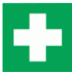
miesto prvej pomoci