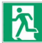
úniková cesta, únikový východ